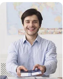
Gestão de Turismo Tourism Management