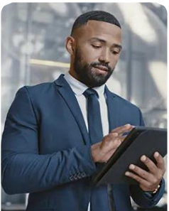
Gestão de Turismo Tourism Management