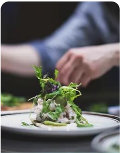
Gestão e Produção de Cozinha Culinary Arts