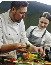
Gestão e Produção de Cozinha Culinary Arts