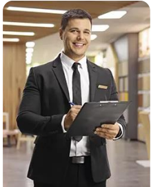
Gestão de Restauração e Bebidas Food and Beverage Management