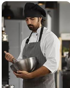
Técnicas de Cozinha/Pastelaria Culinary and Pastry Techniques