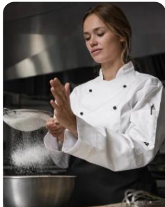
Gestão e Produção de Pastelaria e Padaria Pastry and Bakery Arts