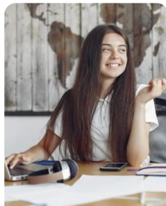
Técnico/a de Turismo Tourism Techniques