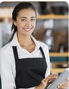
Técnicas de Serviço de Restauração e Bebidas Restaurant and Bar Techniques