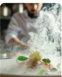
Inovação e Desenvolvimento de Produtos Alimentares Innovation and Food Product Development