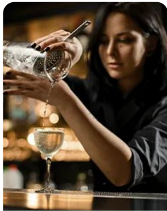
Gestão de Restauração e Bebidas Food and Beverage Management