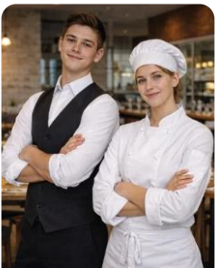
Técnico/a de Cozinha e Restauração Culinary and Restaurant Techniques