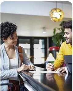
Gestão Hoteleira e Alojamento Hospitality Operations Management