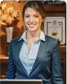
Gestão Hoteleira e Alojamento Hospitality Operations Management