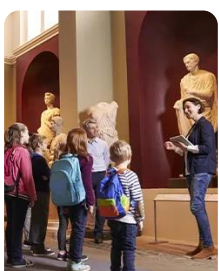
Turismo Cultural e Património Heritage and Cultural Tourism