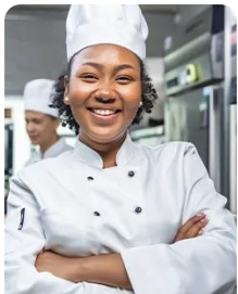
Gestão e Produção de Pastelaria e Padaria Pastry and Bakery Arts